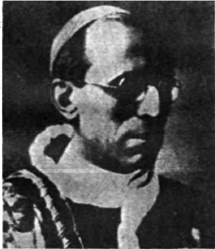
Eugenio Pacelli - Antichrist Papst Pius XII

Man hofft, dass die protestantischen Nationen diese neue internationale Lösung eines "Oberhauptes der Christenheit " nicht akzeptieren werden, die der Heilige Stuhl in die allgemeine Akzeptanz durch die Hintertür zu schmuggeln